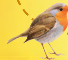
Hoor je het roodborstje fluiten?