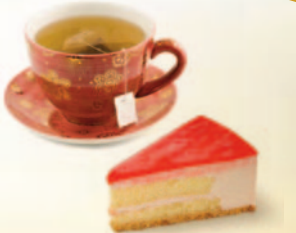
Kopje thee drinken bij bakker Gerritsen?